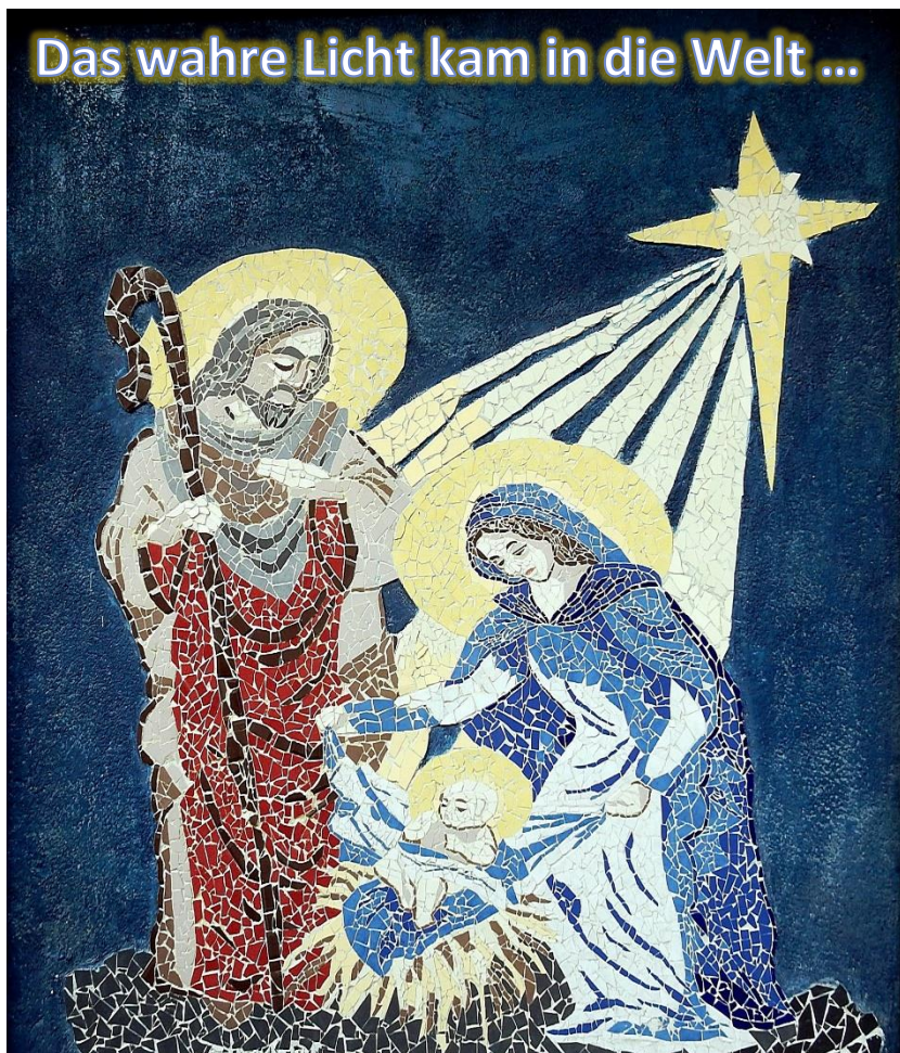
Bild: Friedbert Simon, Mosaik an Hauswand in Bethlehem, Pfarrbriefservice.de